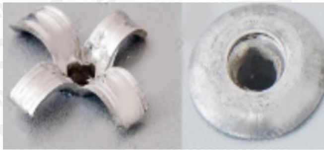
Заклепка після складання